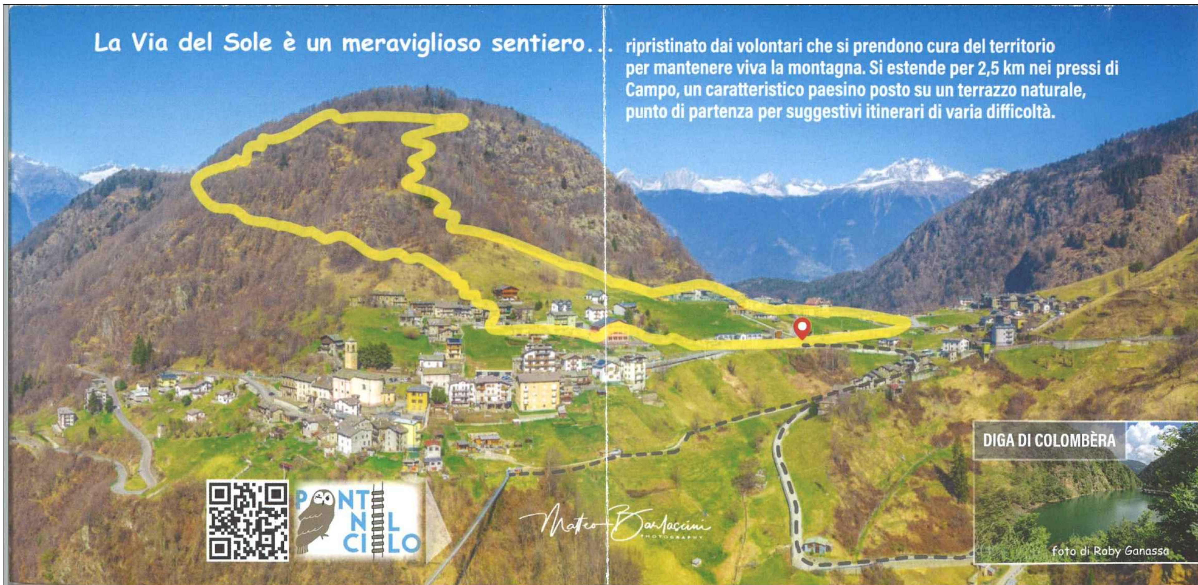
DIGA DI COLOMBÈRA

ripristinato dai volontari che si prendono cura del territorio per mantenere viva la montagna. Si estende per 2,5 km nei pressi di Campo, un caratteristico paesino posto su un terrazzo naturale, punto di partenza per suggestivi itinerari di varia difficoltà.